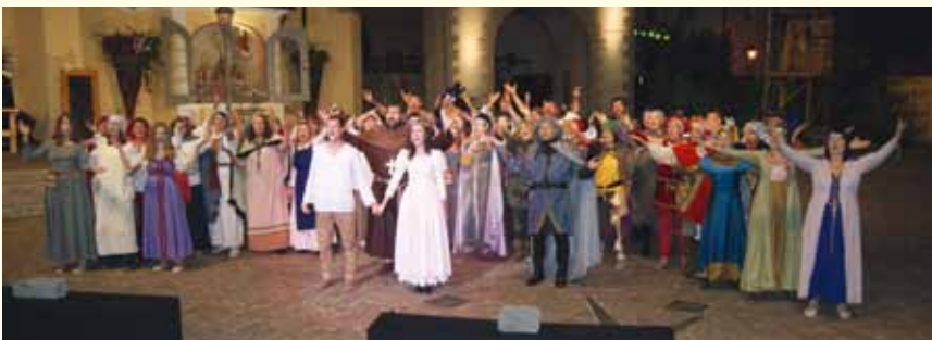
Ein grandioses Bild bot der Schlusschor mit dem gefühlvoll beleuchteten Marienplatz als Kulisse