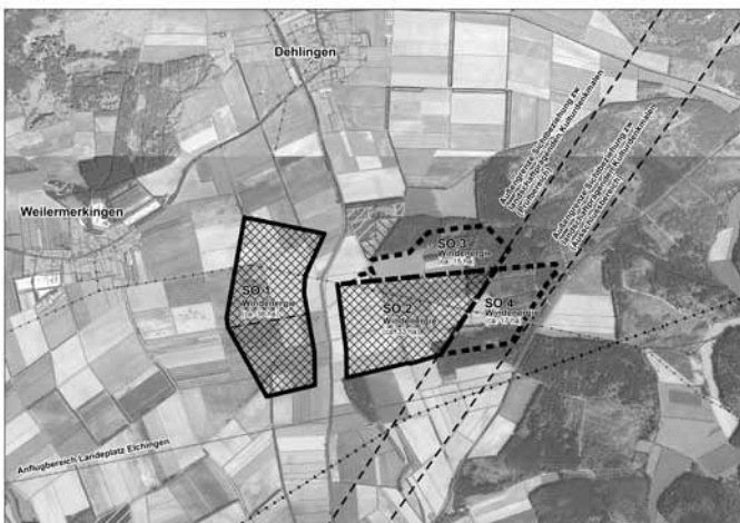
„Über diese Konzentrationsflächen für Windkraftanlagen (SO 1 – SO 4) hat der Gemeinderat intensiv beraten. Im Gebiet SO 1 befindet sich die bisher bereits mit 3 Windanlagen bebaut Fläche oberhalb (nördlich) der gestrichelten Linie.“

Danach wurden 4 Architekturbüros im Rahmen einer Mehrfachbeauftragung