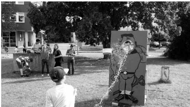
Schwammwerfer in Aktion

Auch der Förderverein war mit einem Grillstand vertreten. Daneben war auch Kurzweil angesagt, da man sich bei einem Tischkickerturnier vergnügen konnte. Dicht umlagert war selbstverständlich der Stand, an welchem die Schülerinnen und Schüler ihre Lehrerschaft mal so richtig nass machen konnten: Das Schwammwerfen auf Lehrer war ein sicherer Hit! Das Wetter lockte neben der Schülerschaft auch etliche Eltern sowie ehemalige Schüler und Lehrer. Selbst das Hobby Tischtennis wurde von einem ehemaligen Schüler vorgestellt und man konnte erste Erfahrungen sammeln. An den vielen schattigen Tischen konnte man ein Schwätzchen führen, ganz entspannt und vielleicht garniert mit einem der fruchtigen alkoholfreien Cocktails oder Slush-Eis schlüpfend. Das Fazit lautet klar: Schön war's.