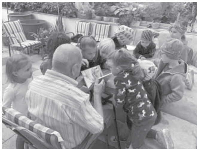
Märchenstunde mit dem Seniorenbeirat