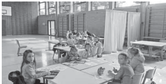
Goldene Mandalas bemalen