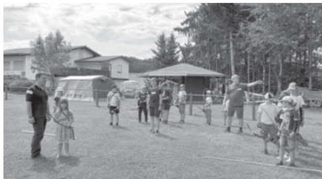
Traditionelles Bogenschießen