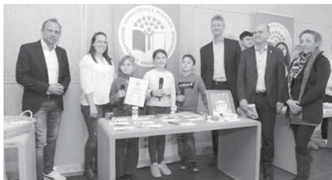
Die Gruppe der Bachtal-Grundschule zusammen mit Umweltminister Glauber, Kultusminister Piazzolo und Herrn Schäffer vom LBV.

Auch dieses Jahr darf sich die Bachtal-Grundschule wieder über die Auszeichnung „Umweltschule in Europa“ mit drei Sternen – der Bestnote – freuen. Als einzige Grundschule aus ganz Bayern durfte sie zudem am 07.12.2022 persönlich mit einer kleinen Abordnung (drei SchülerInnen und zwei Erwachsenen) an der Auszeichnungsveranstaltung in München teilnehmen und dabei das Schülerlädle vorstellen, worauf natürlich nicht nur die Kinder besonders stolz sind.